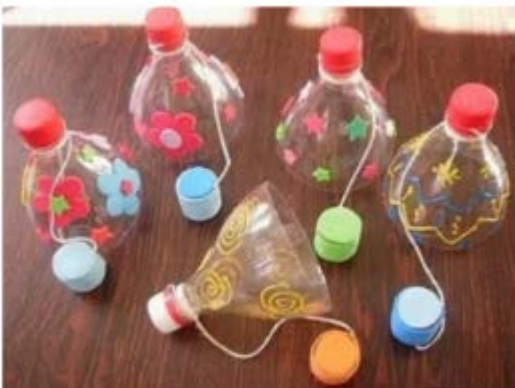
BOTELLAS DE AGUA, GASEOSA, ETC. TAPONES Y CORDÓN